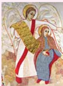
Ecco, concepirai un figlio, lo darai alla luce e lo chiamerai Gesù.